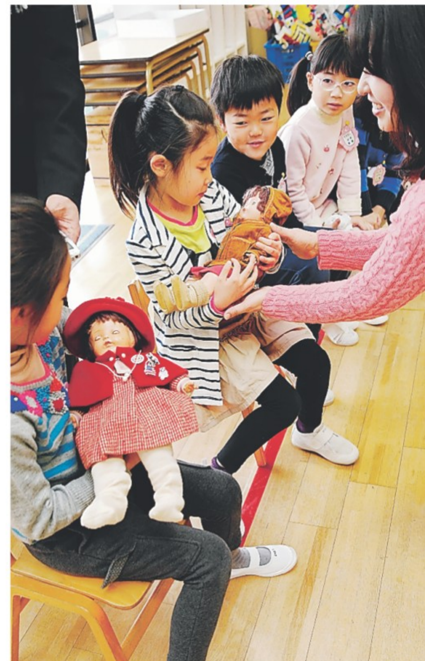
人形の「メリー」(手前)と「ローズ」を抱く園児たち=27日午前、甲南幼稚園

昭和初期、米国から日本の子どもたちに贈られた「人形」。戦争で大半不明、日米友好の人形2体「再会」。