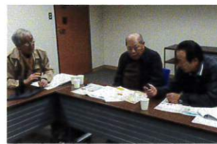
アイデア・発明委員会

現在の若者が楽しむゲームと言えば、スマホ・PC相手に個人が遊ぶもの。昔はもっと人と人のコミュニケーションツールとしてゲームを楽しん